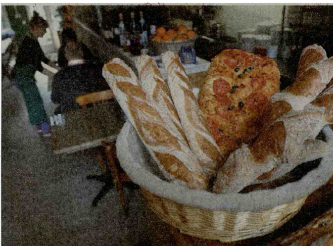
Goed brood bij Mangiare.