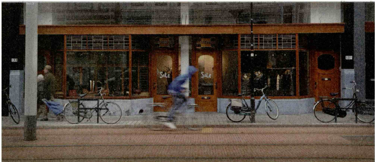
De Van Oldenbarneveltstraat wordt de hipste straat van Rotterdam genoemd.