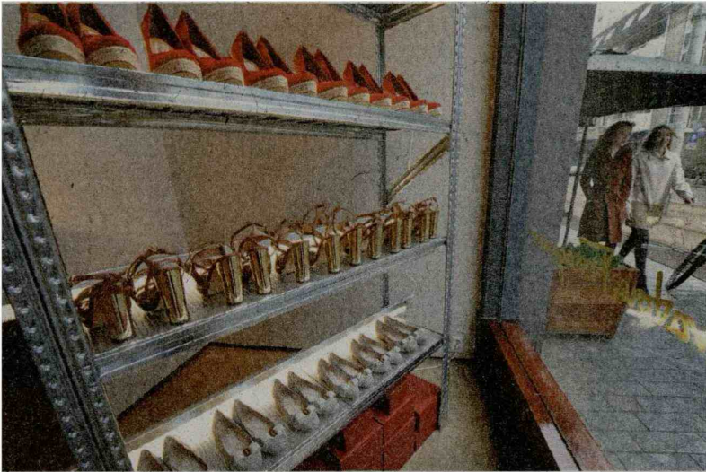
Schoenen bij Mostert & Van Leeuwen.